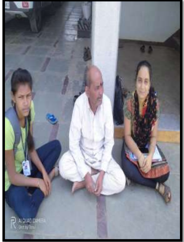
अतीट गावातील ग्रामस्थांशी संवाद साधताना विद्यार्थी व प्राध्यापक वृंद