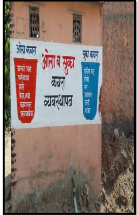
अतीट गावात जनजागृतीसाठी तयार केलेल्या बोलक्या भिंती